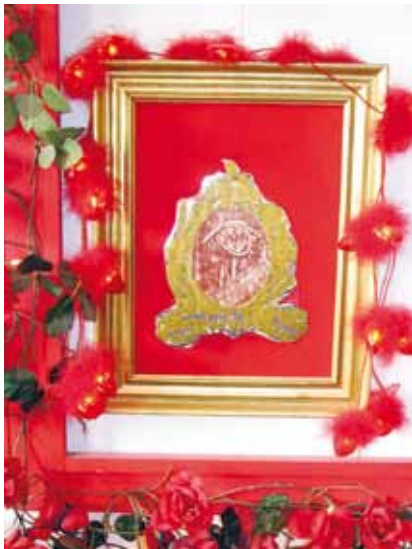
Als je jarig bent kan iedereen dat zien. Je foto hangt in deze lijst en de lampjes branden.