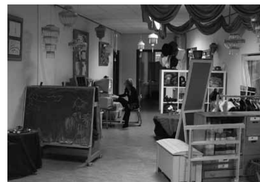
↑ Clusteroverzicht. Deze ruimte wordt gebruikt door OB, MB en BB (van elk één stamgroep).

In de themakast staan alleen ontwikkelings- materialen die bij het thema horen.