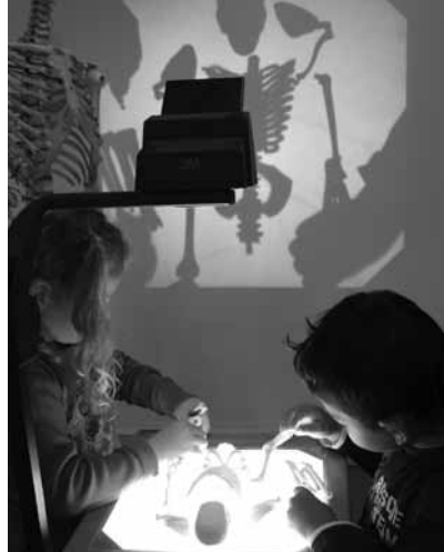
Overheadprojector: 'de toverlamp'.