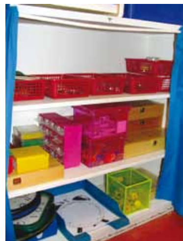
Materialenkast met cijfers, vergrootglazen, spiegels, linialen, stempels, geld enz. Alles te combineren met de materialen uit de potten.