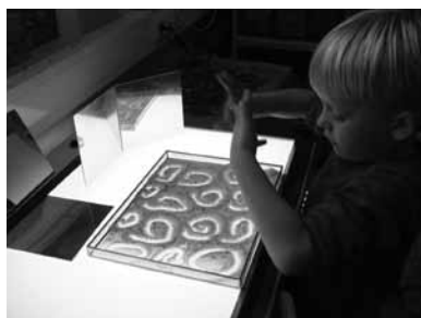
Lichtbakken om nog gerichter te kunnen kijken.