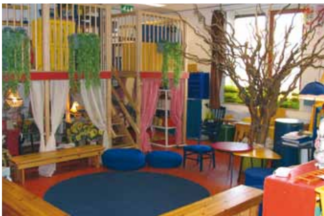
Centraal in de groep staat in de vaste kring de toverboom. De boom past zich aan elk thema aan.