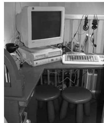
Thema-activiteiten op de computer.