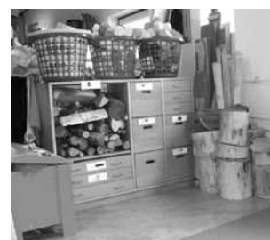
← Bouwhoek ... met echte stenen.

Allerlei echte bouwmaterialen zichtbaar gerangschikt.