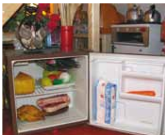
Uiteraard een goed gevulde koelkast in de keuken.