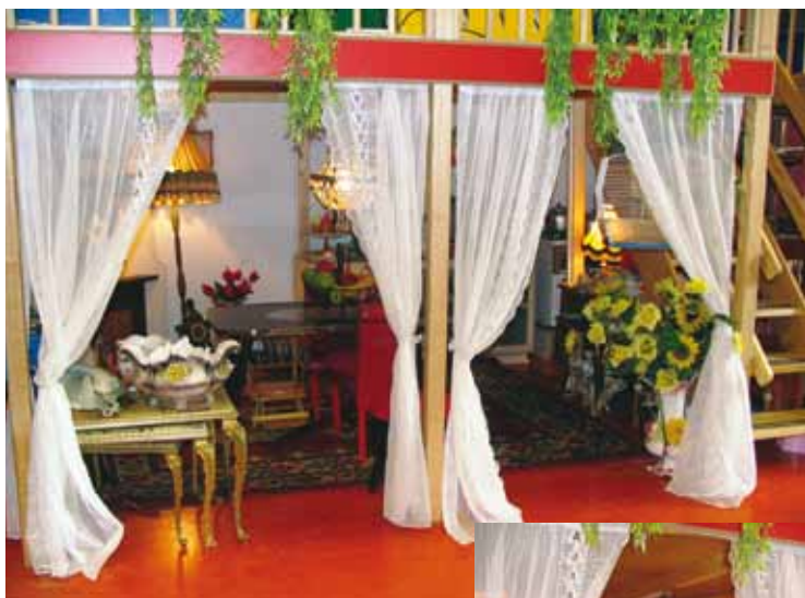
Een kijkje in de huiskamer.