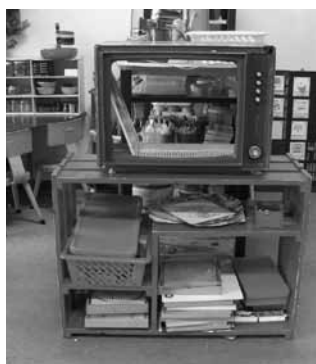
← Verhalen tv en themakast In de verhalen tv ligt een themaprenten- boek met vingerpoppetjes en attributen.

In de themakast staan alleen ontwikkelings- materialen die bij het thema horen.