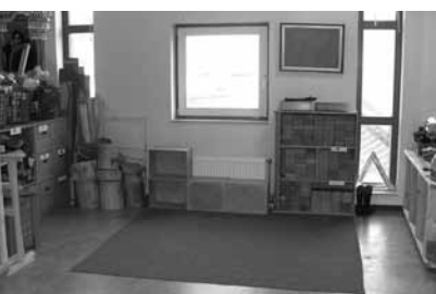
Zand/watertafel. Deze wordt per thema functioneel ingericht

De inrichting is afgestemd op alle groepen: bouwhoek, zand/watertafel, mooie-spuiletjes-kast, tentoonstellingslijsten, prikborden met ouderinfo, wo-tafel, computer, theaterhoek, teken/verfbord.