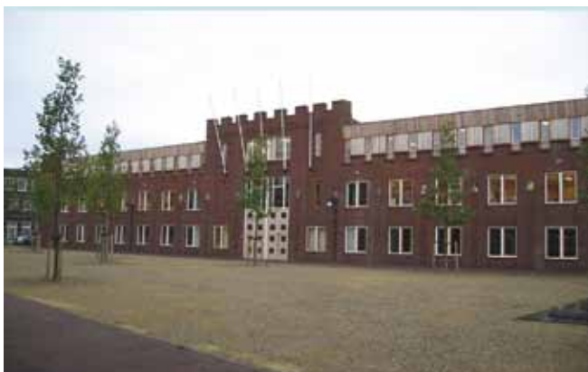
Vooraanzicht jenaplanschool Antonius Abt Engelen

jarig bent, getroost moet worden, als je Pippe thuis hebt gehad of als je te gast bent. Aan de stoel hangt een hangmatje waarin ons troostpopje 'Lunaplopje' ligt.