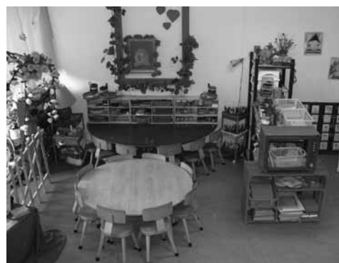
↓ Overzichtsfoto hoek expressieactiviteiten.